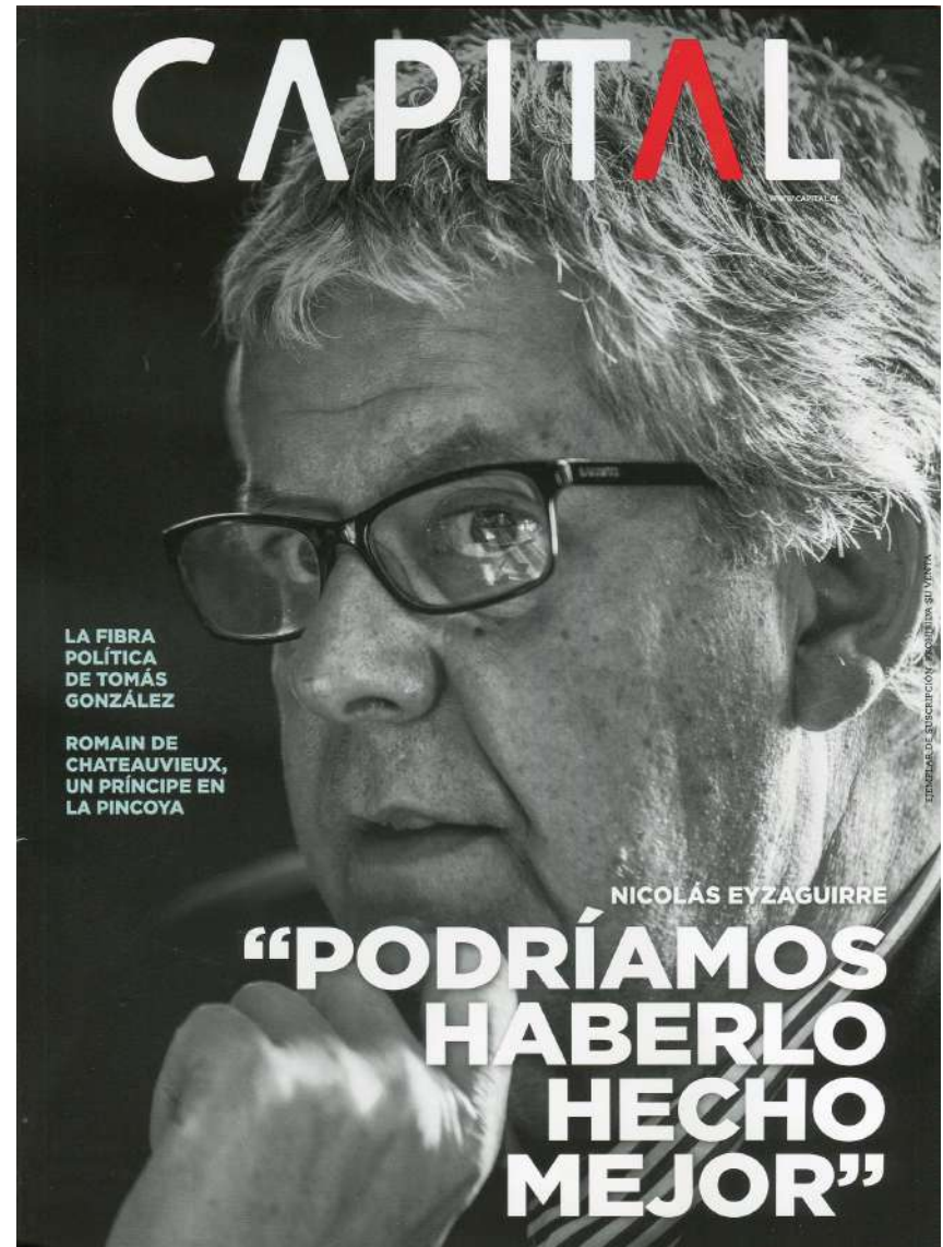
#454, Oct. 2017