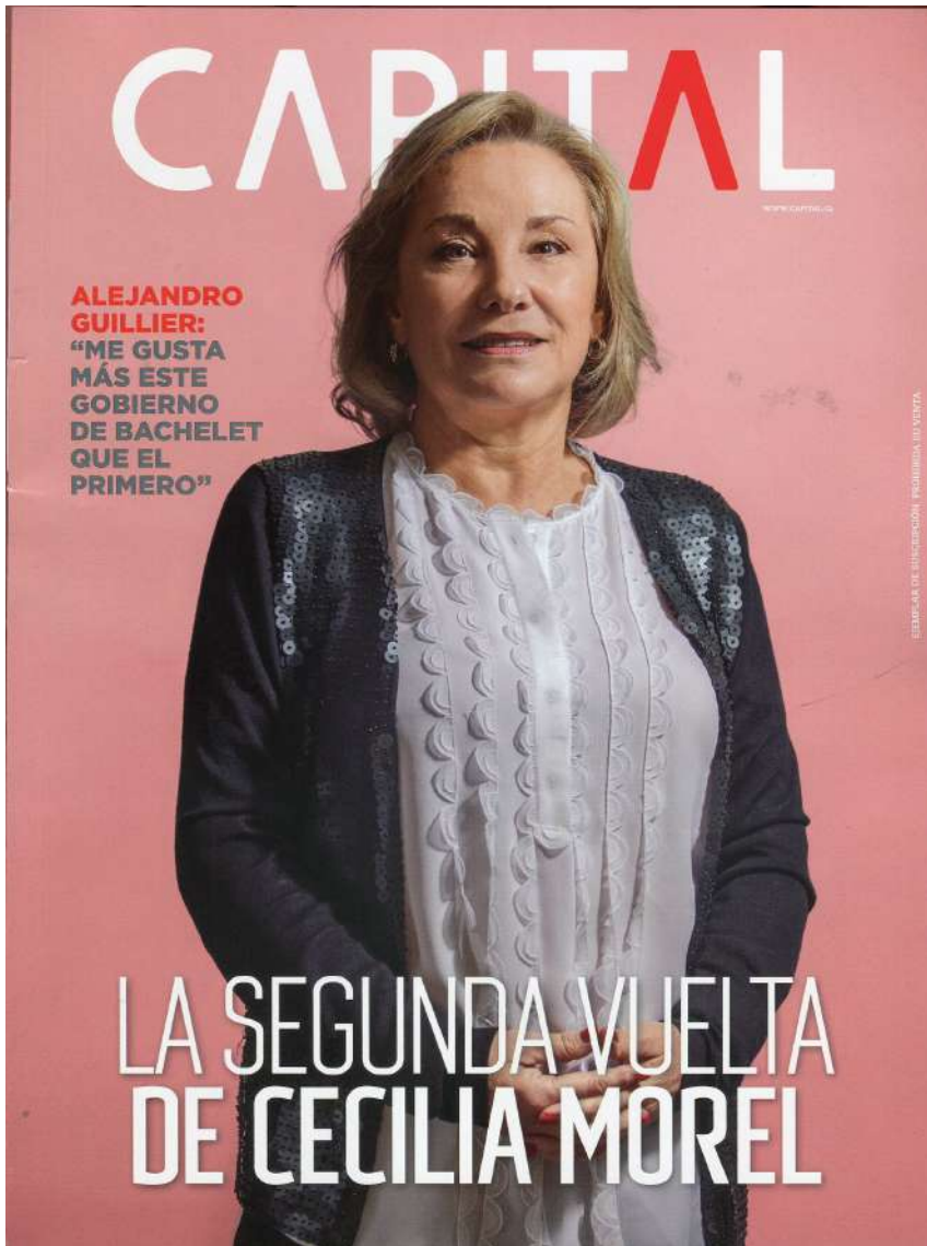
#453, Sept. 2017